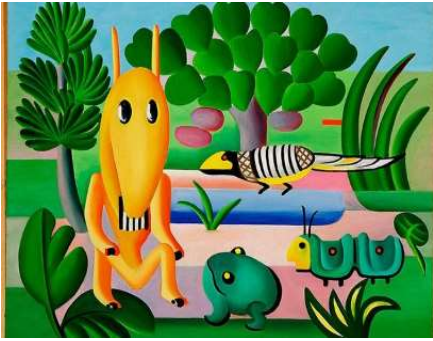
A Cuca, 1924