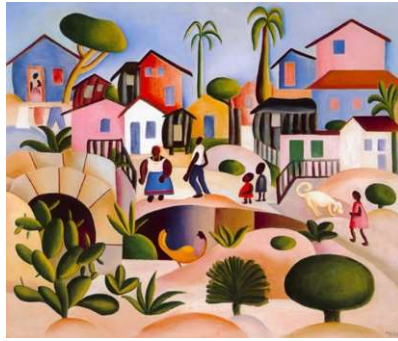
Morro da Favela, 1924