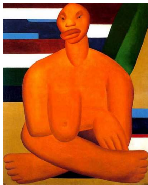
A Negra, 1923